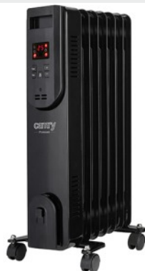
OIL FILLED RADIATOR CR 7812