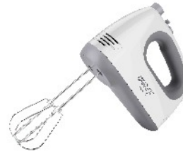
MIXER CR 4220