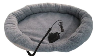
HEATED ANIMAL DEN CR 7431