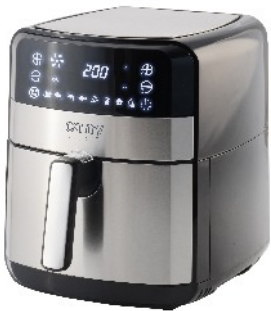
AIR FRYER OVEN CR 6311