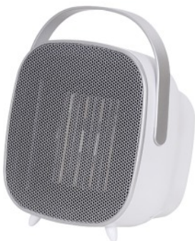
CERAMIC FAN HEATER CR 7732