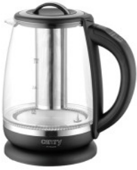
ELECTRIC KETTLE CR 1290