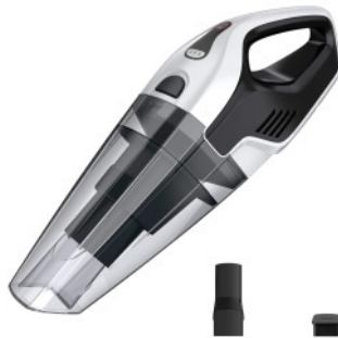
BAGLESS VACUUM CLEANER CR 7046