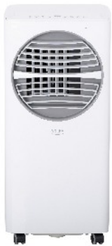
AIR CONDITIONER CR 7925