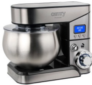
FOOD PROCESSOR CR 4223