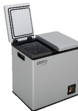
PORTABLE FRIDGE CR 8076