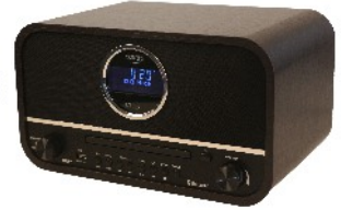
RETRO RADIO CR 1182