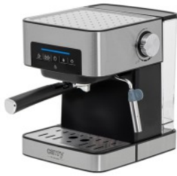
ESPRESSO MACHINE CR 4410