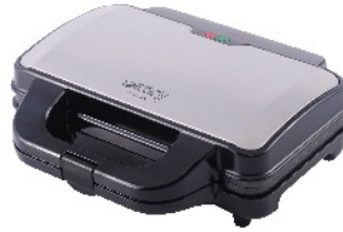
SANDWICH MAKER CR 3054