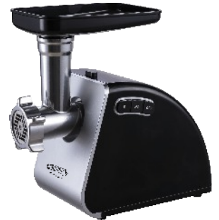
MEAT MINCER CR 4812