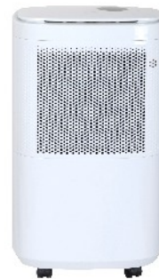
AIR DEHUMIDIFIER CR 7851